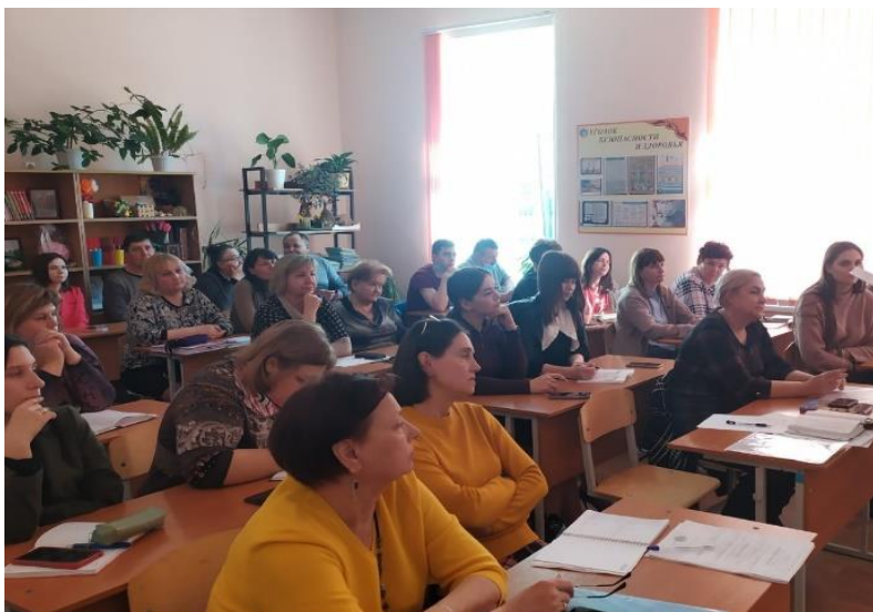
РИСКОВЫЙ ПРОФИЛЬ ШКОЛЫ edu613274